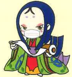
宇治市宣伝大使 ちはや姫